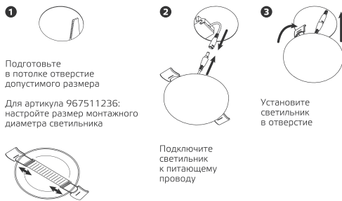
Рис. 2. Порядок монтажа